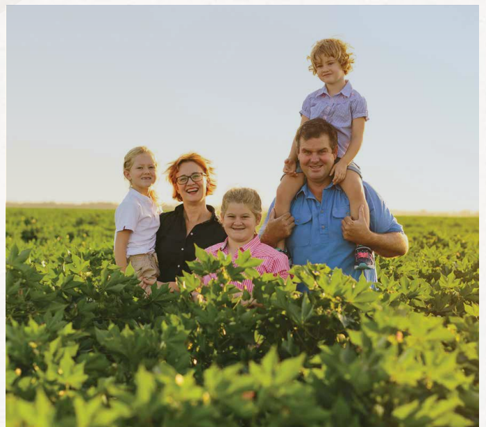
Kapas mendukung mata pencaharian jutaan keluarga petani di seluruh dunia

Serat kapas ditanam di perkebunan, ditanam di lebih dari 100 negara, dan berkontribusi pada mata pencaharian 300 juta keluarga petani dan komunitas mereka di seluruh dunia.