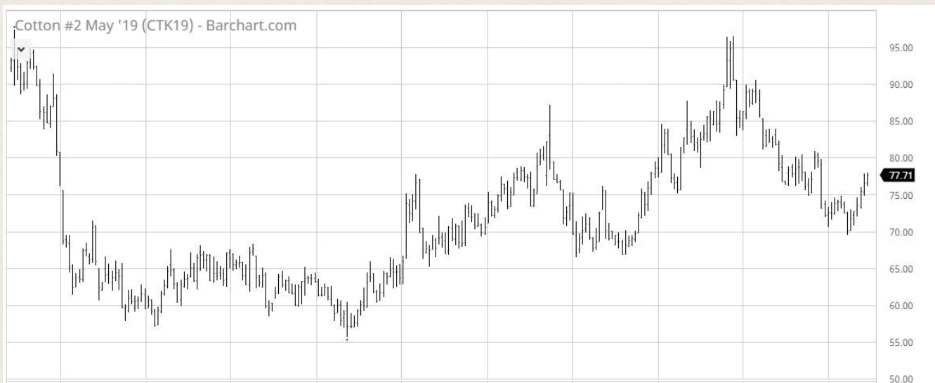
Grafik harga kontrak ini menunjukkan fluktuasi harga kapas selama lima tahun, didorong oleh faktor penawaran dan permintaan yang diuraikan di atas. Sumber: https://www.barchart.com/futures/quotes/CTK19/interactive-chart